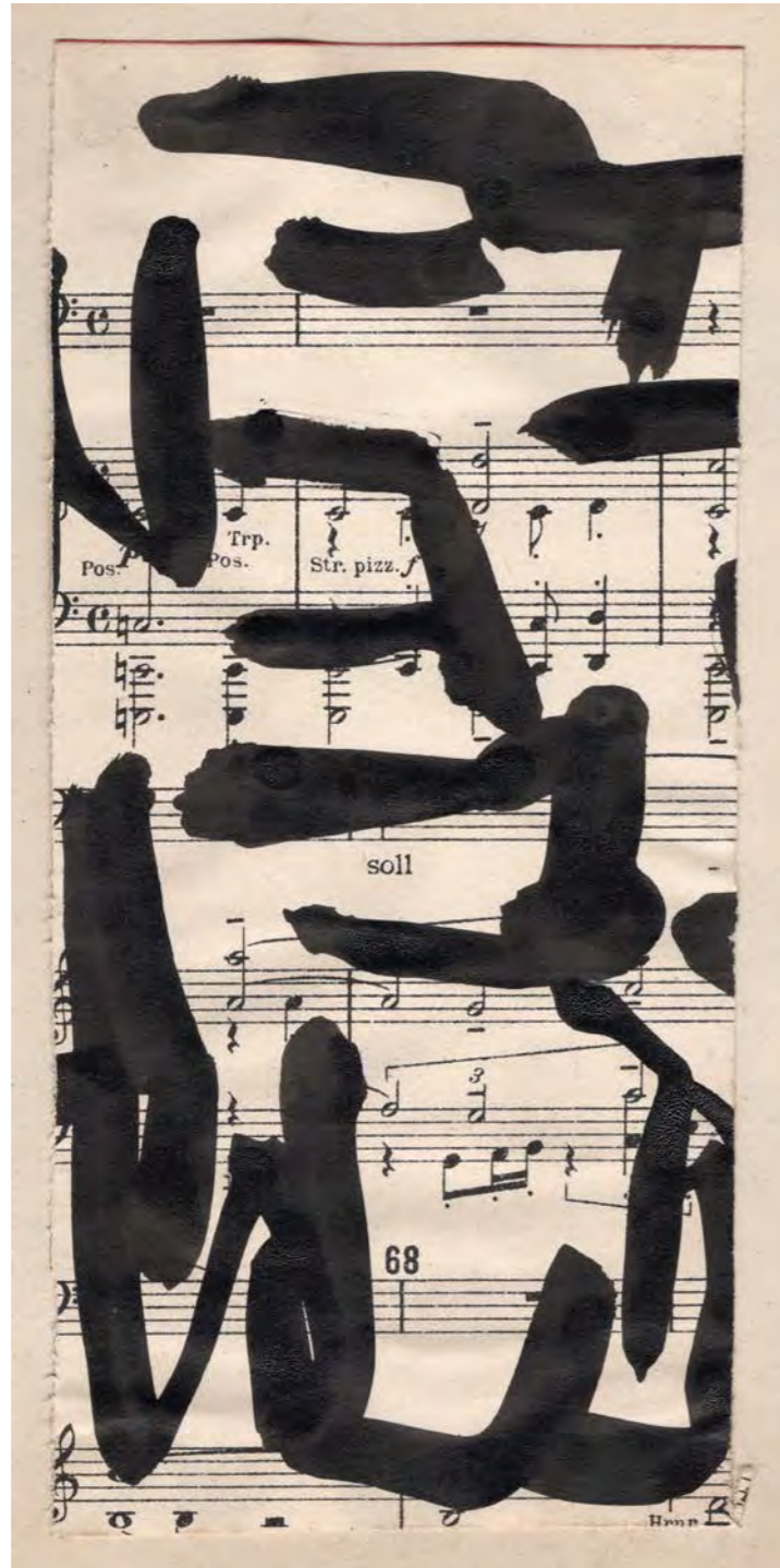
Composition , Encre de Chine sur partition musicale 20 x 9 cm / 7,87 x 3,54 in.