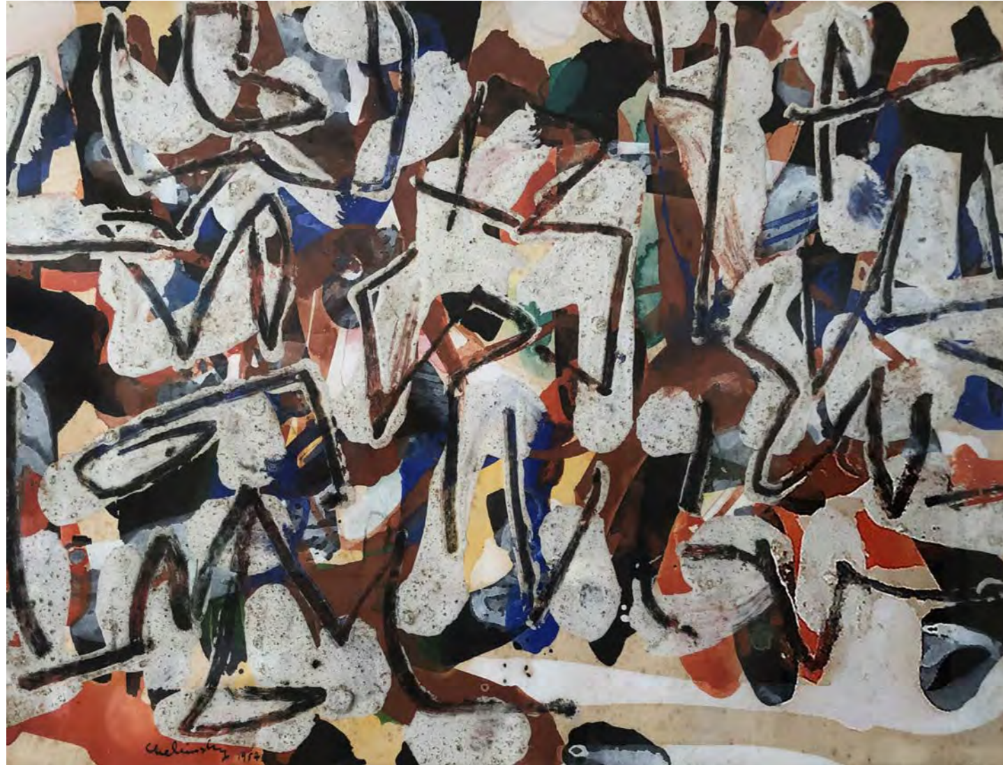
Composition , 1957, Technique mixte sur papier 61 x 79 cm / 24,01 x 31,10 in.