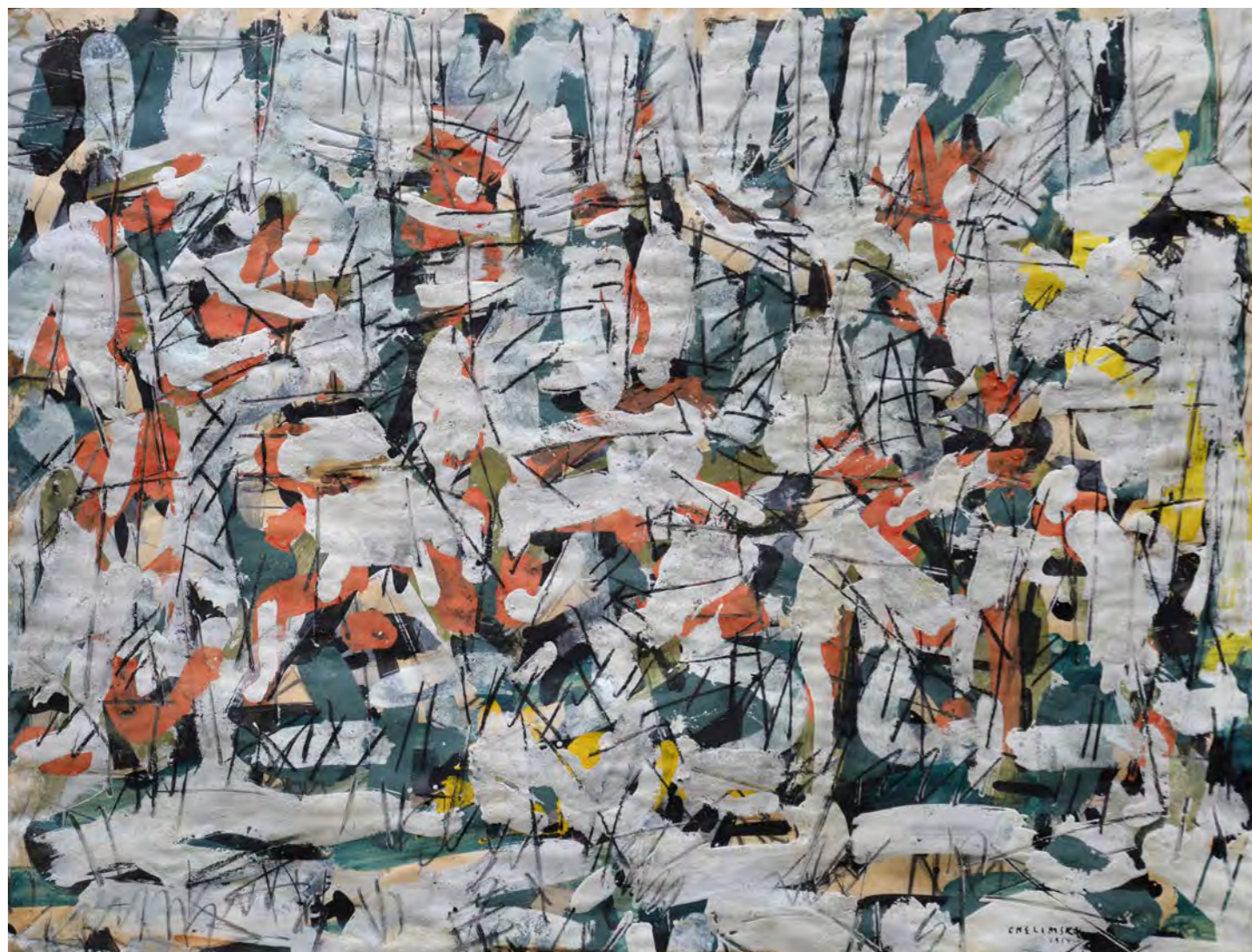
Composition , 1954, Technique mixte sur papier 144 x 189 cm / 56,69 x 74,40 in.