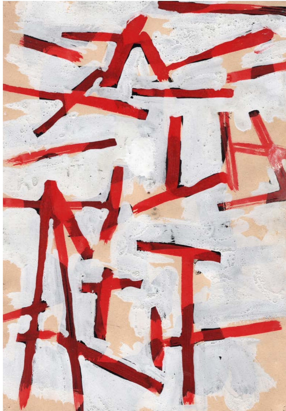
Composition, vers 1952 Technique mixte sur papier 28 x 19 cm / 11,02 x 7,48 in.